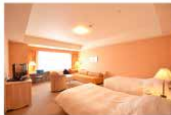
ロイヤルツインルーム