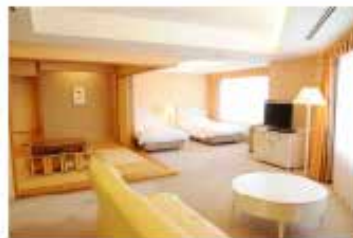
スイートルーム 和洋室