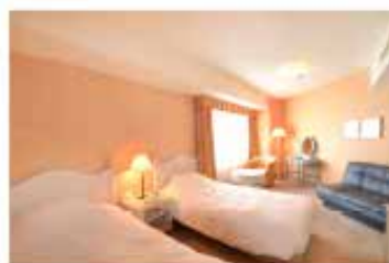
スタンダードツインルーム

大自然と一体化して、リフレッシュ&リラックスに必要な快適さをすべて満たしている。 モダニズムと機能美、華やぎと落ち着きが溶け合ったアートな空間設計は、 リゾートホテルならではの贅沢。